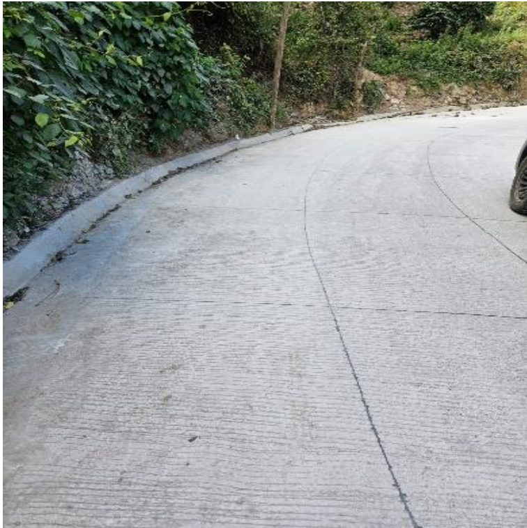
MEJORAMIENTO CAMINO RURAL SECTOR EL CIRUELILLO HACIA ALDEA LOS AMATES, EL CHOL, BAJA VERAPAZ, SNIP 330215. AVANCE FISICO 100.00%