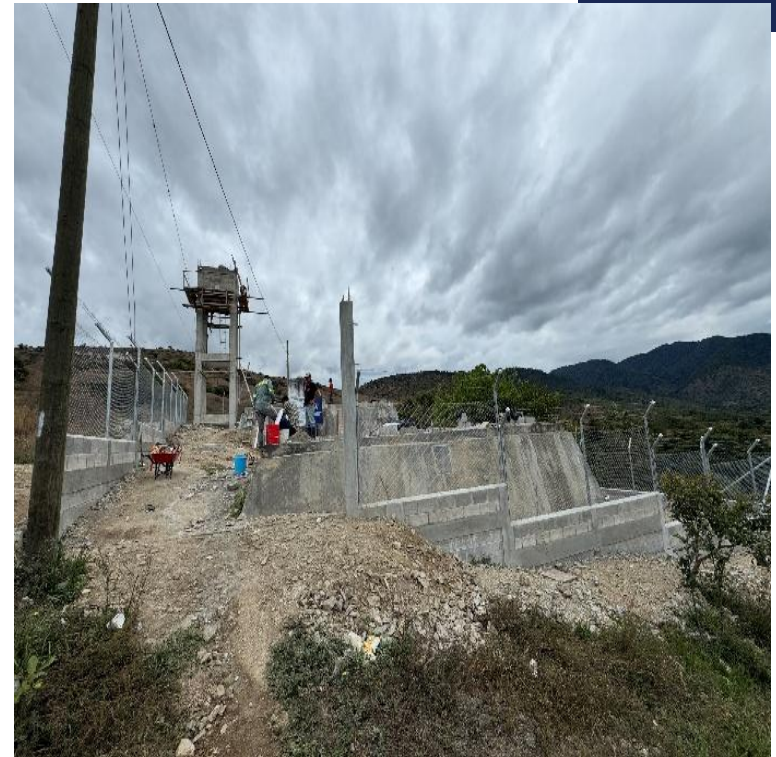
MEJORAMIENTO SISTEMA DE AGUA POTABLE ALDEA NIMACABAJ RABINAL, BAJA VERAPAZ. SNIP 315706. AVANCE FISICO 100%