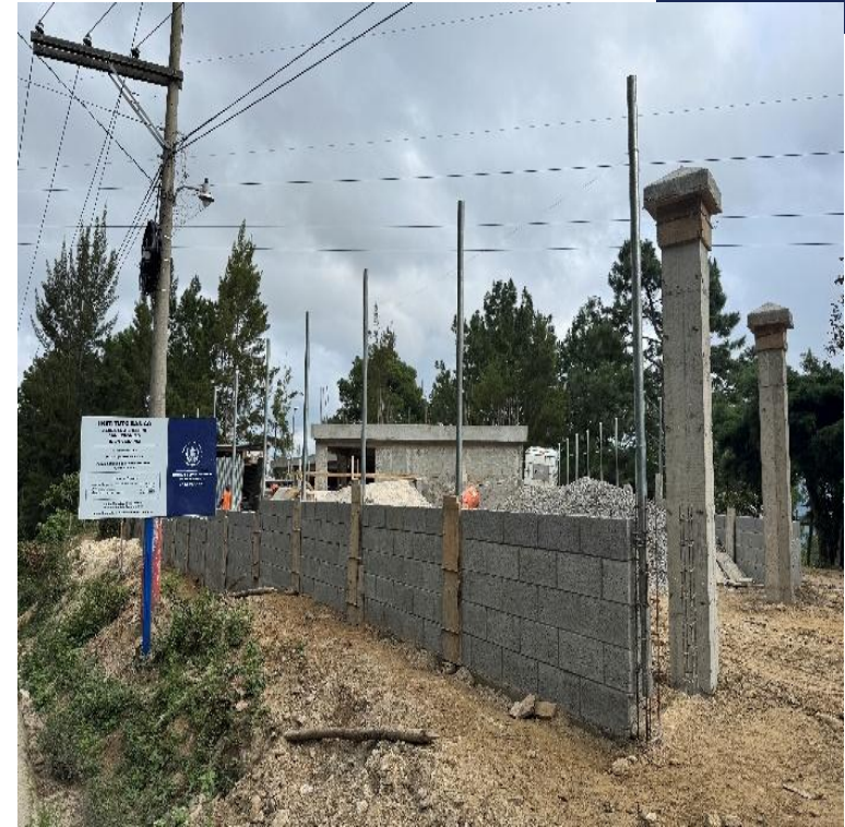
CONSTRUCCION INSTITUTO BASICO ALDEA EL ASTILLERO SAN JERONIMO, BAJA VERAPAZ. SNIP 315509. AVANCE FISICO 76.24%