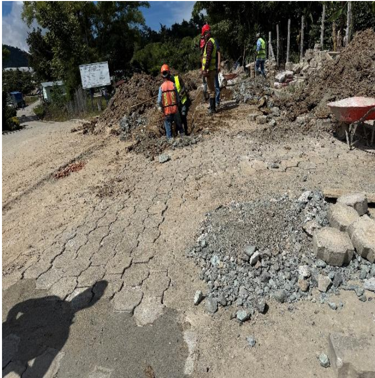
CONSTRUCCION SISTEMA DE ALCANTARILLADO SANITARIO ALDEA MATANZAS SAN JERONIMO, BAJA VERAPAZ. SNIP 315447. AVANCE FISICO 74.59%