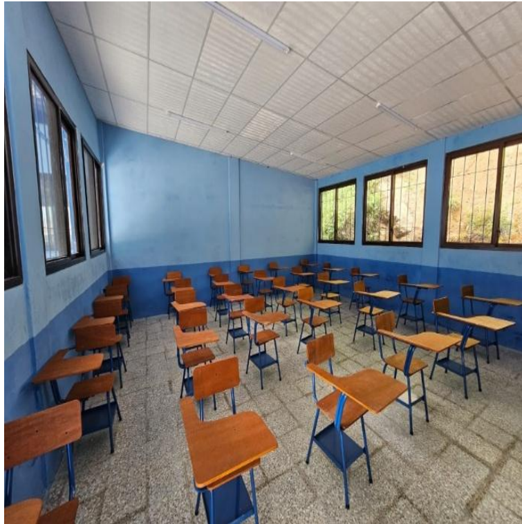
CONSTRUCCION ESCUELA PRIMARIA OFICIAL RURAL MIXTA ALDEA PEÑA DEL ANGEL, PURULHA, BAJA VERAPAZ, SNIP 330423. AVANCE FISICO 100.00%