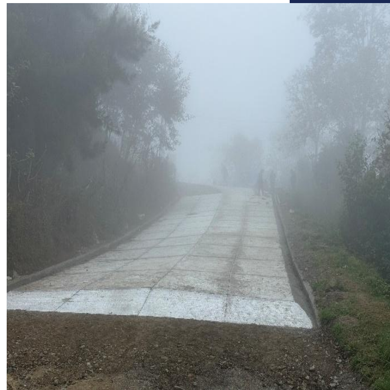
MEJORAMIENTO CAMINO RURAL RUTA HACIA ALDEA TRES CRUCES CUBULCO, BAJA VERAPAZ. SNIP 316048. AVANCE FISICO 92.02%