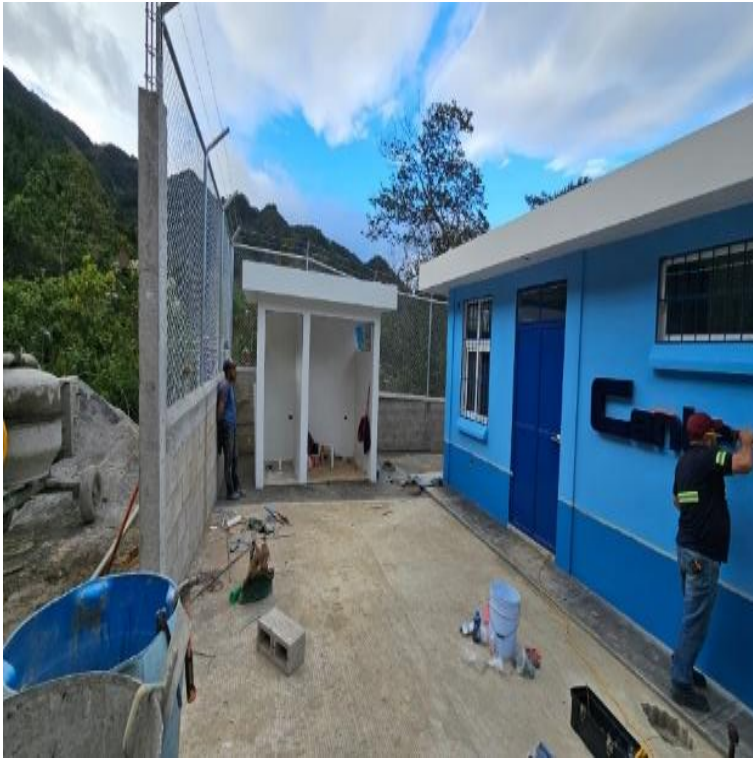
CONSTRUCCION CENTRO COMUNITARIOS DE SALUD CASERIO EL COLMENAR, GRANADOS, BAJA VERAPAZ, SNIP 313991. AVANCE FISICO 96.97%