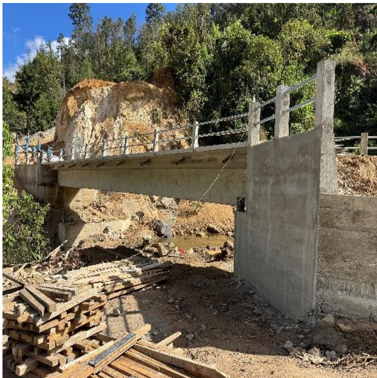
CONSTRUCCION PUENTE VEHICULAR CASERIO TURBALA CUBULCO, BAJA VERAPAZ. SNIP 316047. AVANCE FISICO 96.50%