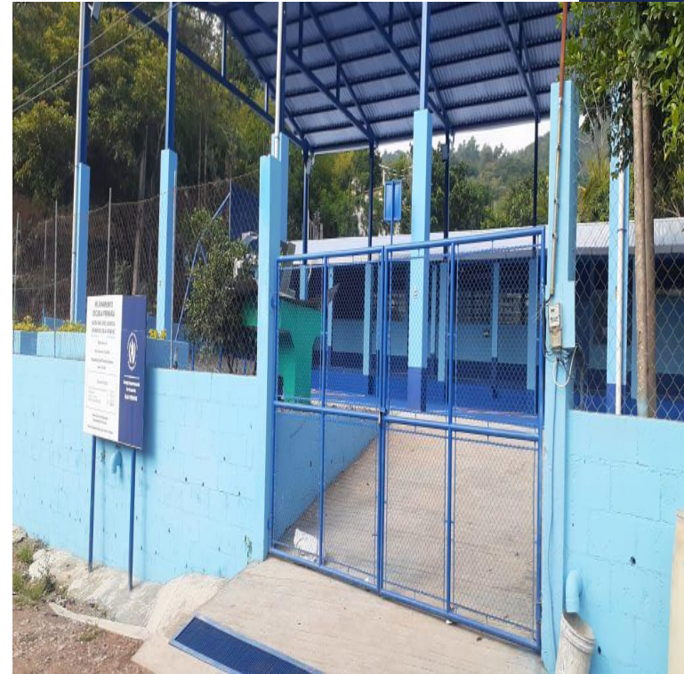
MEJORAMIENTO ESCUELA PRIMARIA ALDEA SAN JOSE SUCHICUL, GRANADOS, BAJA VERAPAZ, SNIP 313977. AVANCE FISICO 100.00%