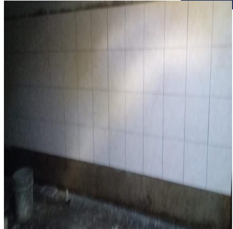
MEJORAMIENTO SISTEMA DE AGUA POTABLE ALDEA LOS AMATES, EL CHOL, BAJA VERAPAZ, SNIP 316103. AVANCE FISICO 74.94.00%