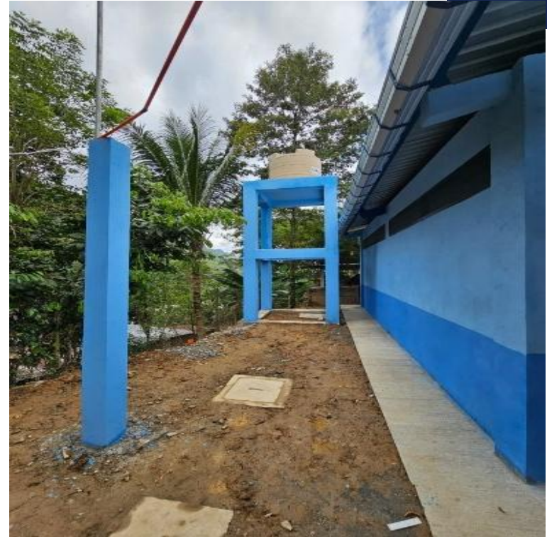
CONSTRUCCION INSTITUTO BASICO CASERIO SANTA ELENA PANIMA, PURULHA, BAJA VERAPAZ, SNIP 330281. AVANCE FISICO 100.00%