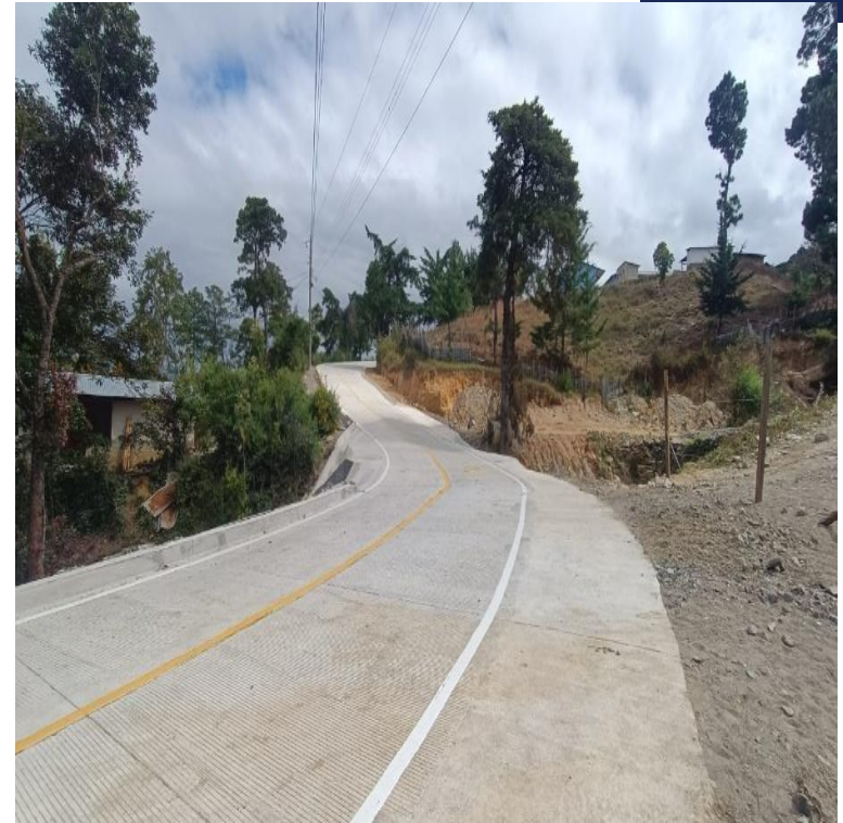
MEJORAMIENTO CAMINO RURAL DEL KILOMETRO 161.9 AL KILOMETRO 162.9 ALDEA LAS ANONAS SALAMA, BAJA VERAPAZ. SNIP 315963. AVANCE FISICO 96.99%