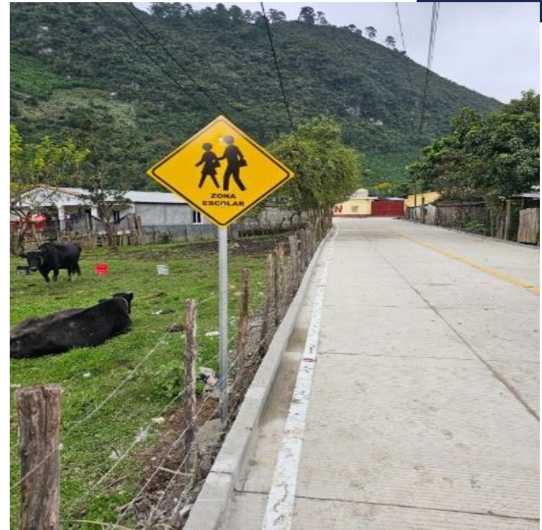
MEJORAMIENTO CAMINO RURAL HACIA SECTOR LA ESCUELA ALDEA MOCOHAN, PURULHA, BAJA VERAPAZ, SNIP 315996. AVANCE FISICO 100.00%