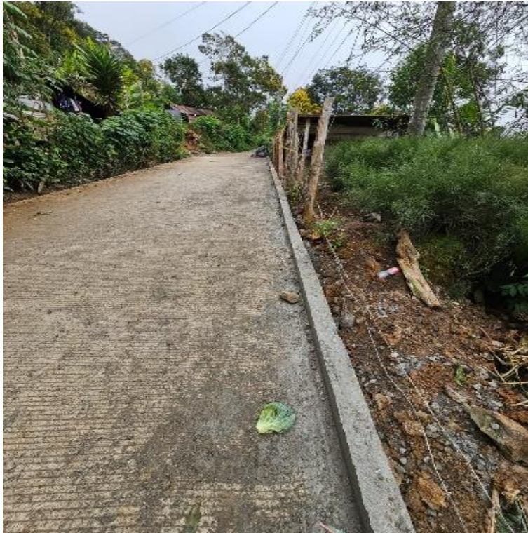
MEJORAMIENTO CAMINO RURAL CASERIO SUQUINAY II SECTOR LA ESCUELA, PURULHA, BAJA VERAPAZ, SNIP 315997. AVANCE FISICO 100.00%