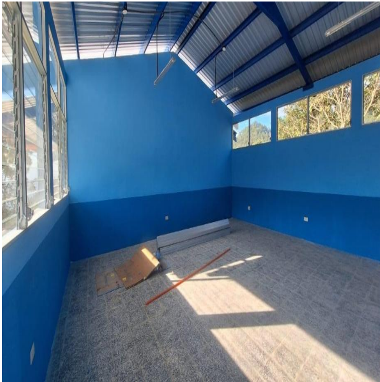
CONSTRUCCION ESCUELA PRIMARIA ALDEA LOS MAGUEYES SALAMA, BAJA VERAPAZ. SNIP 315954. AVANCE FISICO 92.49%