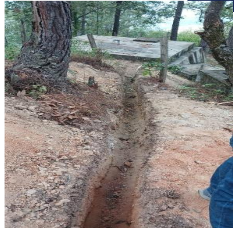
AMPLIACION SISTEMA DE AGUA POTABLE CASERIO POCO, LOS LIMONES, LOS COULOTES, EL CHOL, BAJA VERAPAZ, SNIP 316106. AVANCE FISICO 100.00%