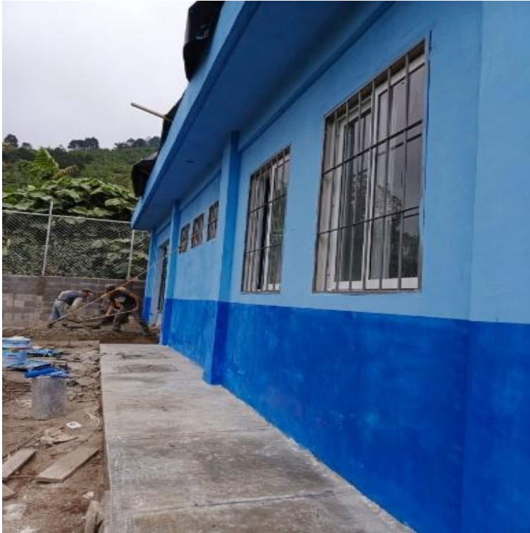
AMPLIACION CENTRO DE SALUD EL COMUNAL, PURULHA, BAJA VERAPAZ, SNIP 315991. AVANCE FISICO 87.14%