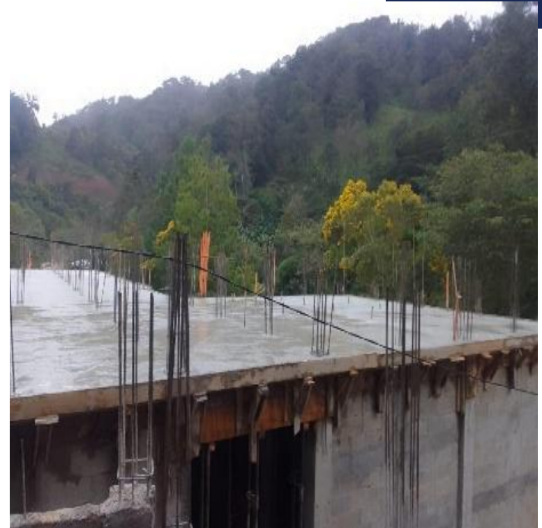
CONSTRUCCION ESCUELA PRIMARIA ALDEA IXCHEL, GRANADOS, BAJA VERAPAZ. SNIP 296006, AVANCE FISICO 60.01%