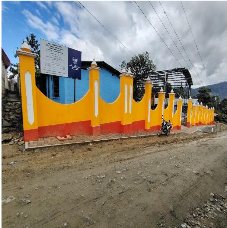
MEJORAMIENTO ESCUELA PRIMARIA ALDEA SAN RAFAEL RABINAL, BAJA VERAPAZ. SNIP 315707. AVANCE FISICO 91.25%