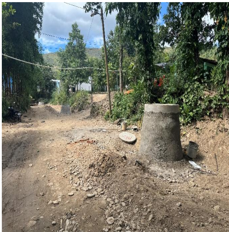
MEJORAMIENTO SISTEMA DE ALCANTARILLADO SANITARIO AREA URBANA SAN MIGUEL CHICAJ, BAJA VERAPAZ. SNIP 316122. AVANCE FISICO 100%