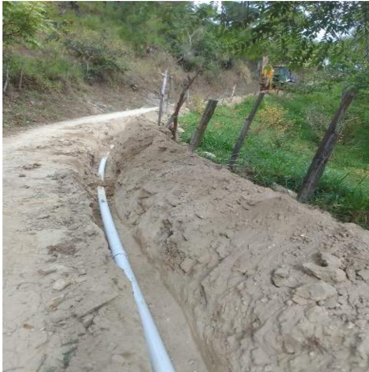
MEJORAMIENTO SISTEMA DE AGUA POTABLE ALDEA LOS JOBOS, OJO DE AGUA, LOS LOCHUYES Y LO DE REYES, EL CHOL, BAJA VERAPAZ, SNIP 316105. AVANCE FISICO 100.00%