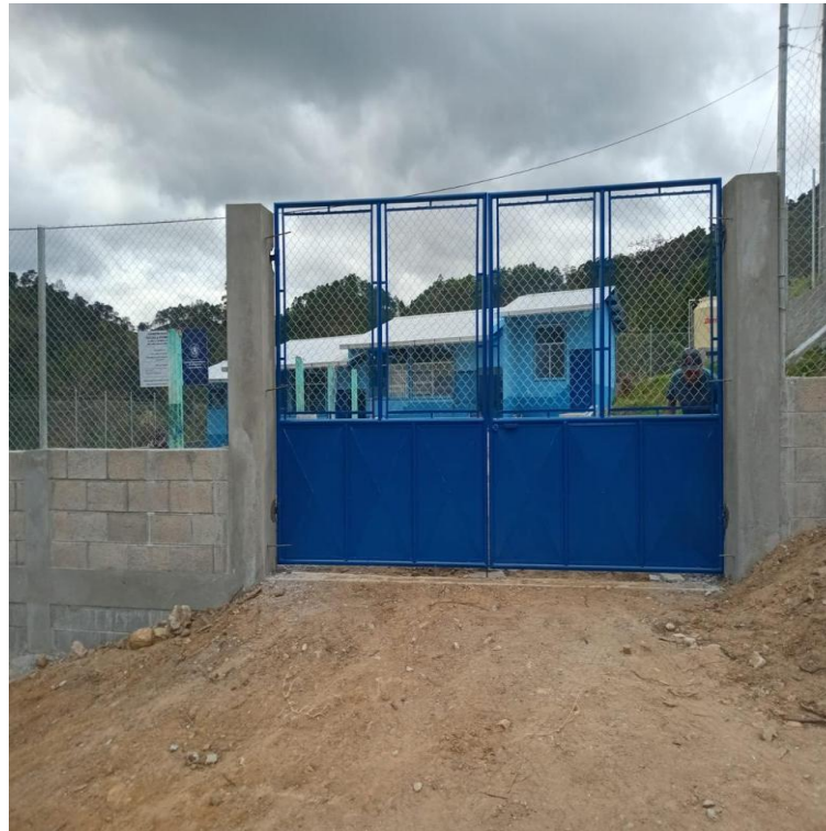
CONSTRUCCION ESCUELA PRIMARIA ALDEA LOS MAGUEYES SALAMA, BAJA VERAPAZ. SNIP 315954 AVANCE FÍSICO 100%