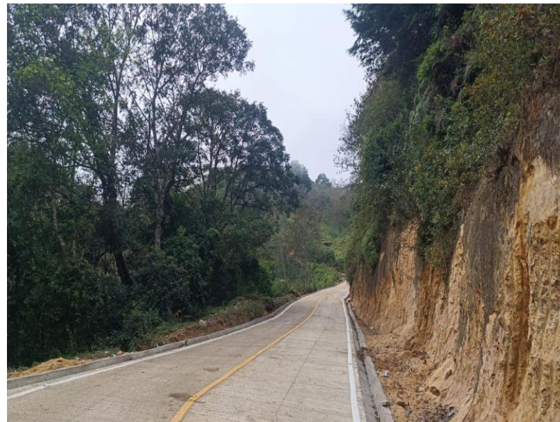
MEJORAMIENTO CAMINO RURAL RUTA HACIA ALDEA TRES CRUCES CUBULCO, BAJA VERAPAZ. SNIP 316048 AVANCE FÍSICO 100%