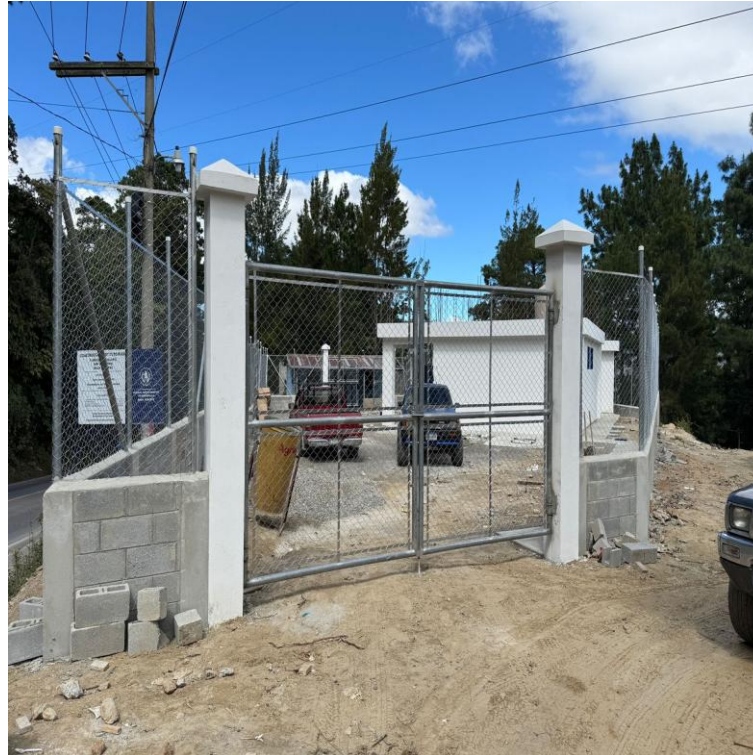
CONSTRUCCION INSTITUTO BASICO ALDEA EL ASTILLERO SAN JEORNIMO, BAJA VERAPAZ. SNIP 315509 AVANCE FÍSICO 91%